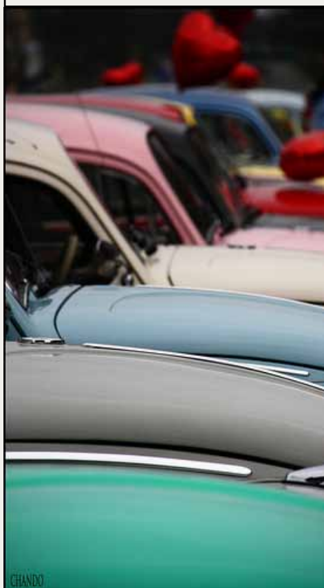
The Love Bugs Parade